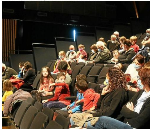
Ce spectacle a été un moment intergénérationnel.

Le 01 novembre 2021 à 15h20, modifié le 01 novembre 2021 à 15h31