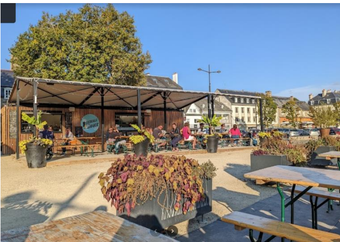
L'escale du Léguer- Lannion