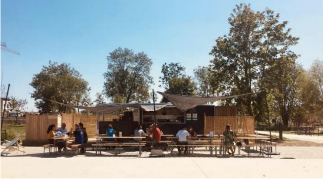
Paillote Flash- Rennes