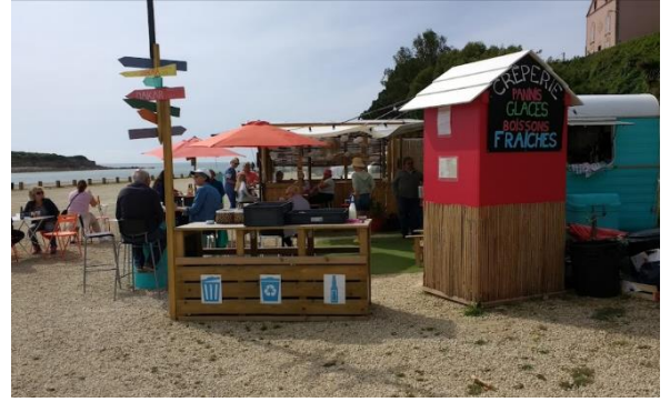
La caravane Bleue - Audierne