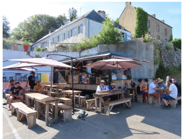
Les Penn sardines - Moëlan-sur-mer